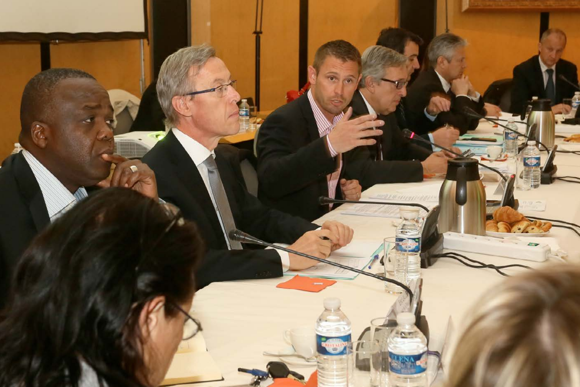
Séance plénière du CISPD en présence du Maire d'Evry, du Procureur de la République et du Directeur Départemental de la Sécurité Publique